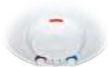
Скрытый вывод водяных патрубков